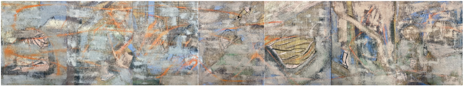
Linda Perthen, Between Being , Acrylfarbe, Acrylspray, Lack und Marker auf Jute / Acrylfarbe, Tusche und Acrylspray auf Papier, sieben Werke je 70 x 90 cm / vierzehn Werke je 35 x 50 cm, 2023, Werk 1-7

Unter dem Titel BETWIXT AND BETWEEN thematisiert die 33. Landesweite Kunstschau den Zustand, in dem wir uns weder an einem noch an einem anderen Ort, sondern in einem Moment des Dazwischen-Seins befinden.