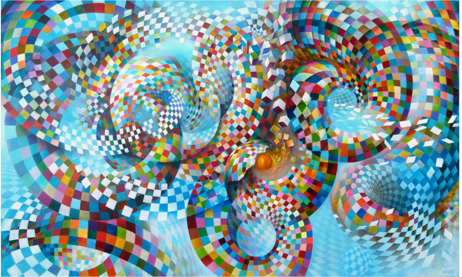
Olaf Hoppe, Aus dem Zentrum an den Rand und zurück , Acryl auf Leinwand, 200 x 120 cm, 2023

Die in der Ausstellung versammelten Kunstwerke veranschaulichen sowohl in der Werft als auch in der Kulturkirche St. Jakobi die Idee des Dazwischen-Seins und der Übergangszustände in unterschiedlichsten Bereichen wie Umwelt, Natur, Mensch, Leben und Tod.